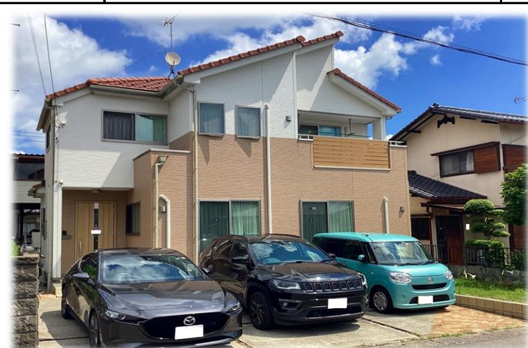
南側前面道路より撮影現地外観 ※街並み含む 掲載写真 2023年8月撮影