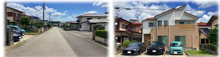
南側前面道路(西側より撮影) 南側前面道路より撮影現地外観